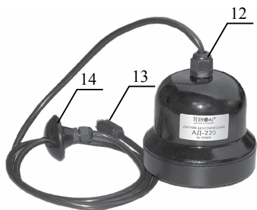
Рис. 1 Приемник и акустический датчик